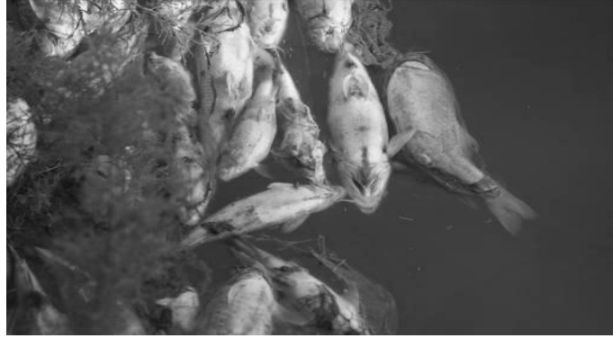
أسماك نافقة طافية على طول نهر مولوية في يوم 2011/07/18