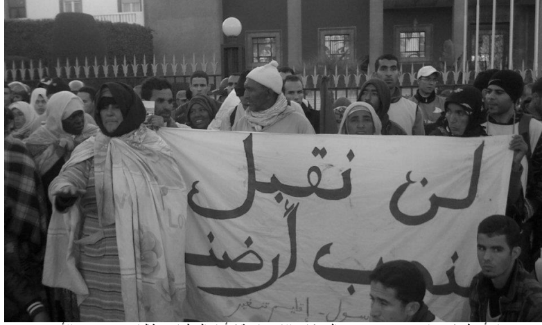
نساء اسول (ضواحي) يتغير يتقدم الحركات الاحتجاجية ( أمام البرلمان مطالبات بحقوقهن في الأرض