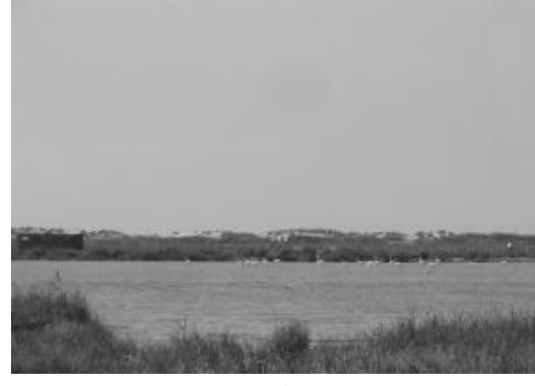
حوض ملوية (سابقا)