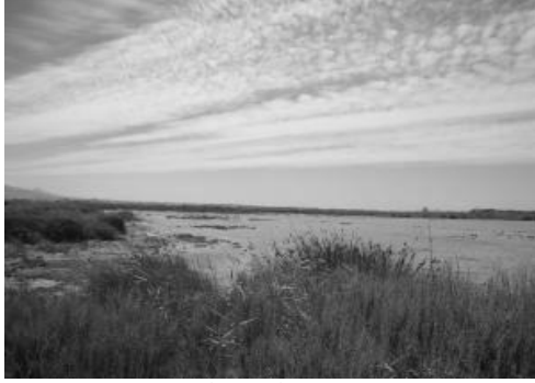
حوض ملوية (حاليا)

إلا أنه رغم هذه الجهود المبذولة، فإن ذلك لا يعفينا من تقييم الوضعية البيئية بالمغرب إذ يتضح أن مؤشرات تدهور البيئة لا زالت مرتفعة وأن مختلف مكونات البيئة لا زالت تعاني من التلوث وأن القوانين البيئية لا تطبق ولا تحترم رغم عدم كفايتها.